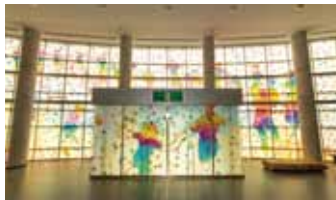
おはながらート・プロジェクト(星空version)