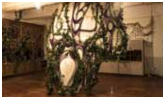
ペイントフェアリング・5S-H型改