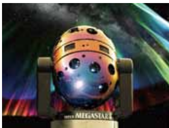
メガスターオフィシャルサイト http://www.megastar.jp/

大平貴之の個人開発によって生まれた光学式プラネタリウムシリーズで、従来の100倍以上の星を投影可能にした。特徴は圧倒的な天の川の表現力と移動可能なこと。肉眼では区別できない微細な星の一粒までをも最小0.7マイクロメートル以下の微細な点で表現することによって、本物の宇宙さながらの奥行きや広がり再現。世界11か国に設置されている。